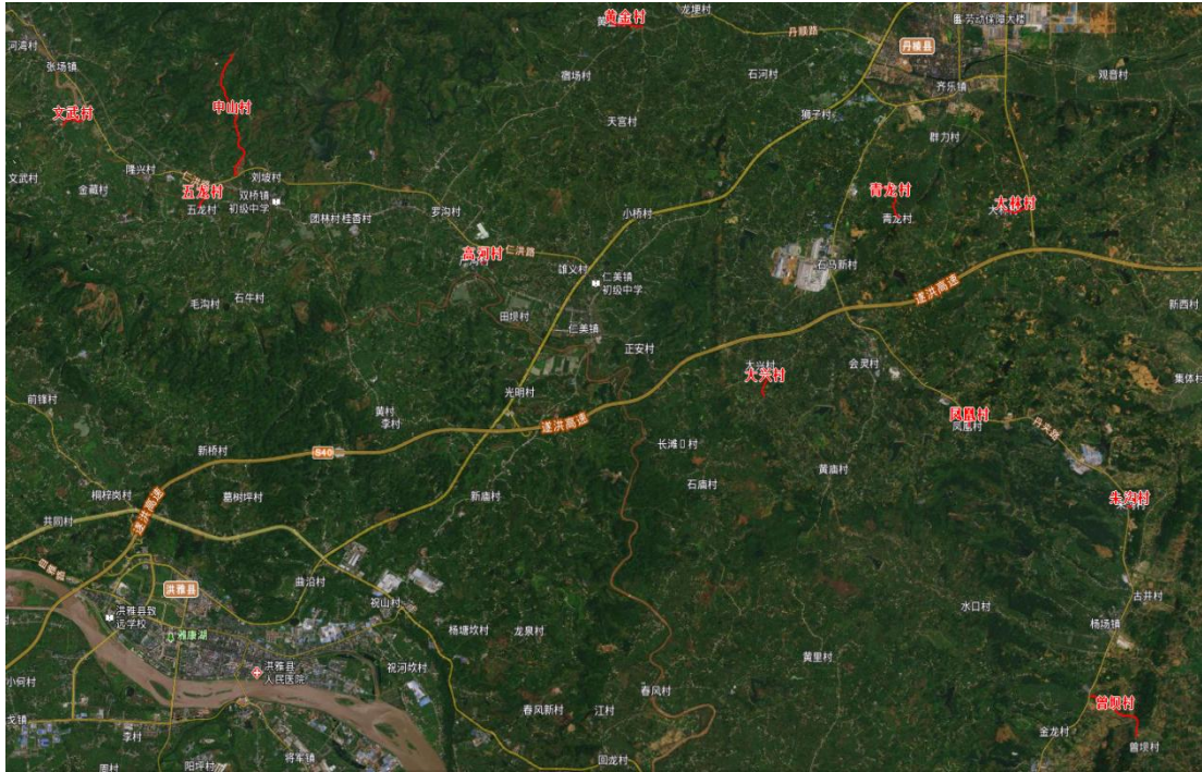
图 1.1-1 项目区地理位置图